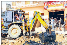
खरखोदा। नालों की सफाई करती जेसीबी।

खरखोदा में नगरपालिका की तरफ से नालों की सफाई करने, अतिक्रमण पर कार्रवाई करने का एक अभियान चलाया गया है। जिससे