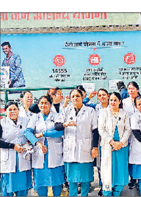
लगाकर काम करेंगी। उसके बावजूद सरकार ने उनकी मांगों को पूरा नहीं