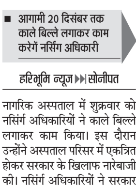
सोनीपत। रोष-प्रदर्शन व काले बिल्ले लगाकर कार्य करते हुए नर्सिंग अधिकारी।

नागरिक अस्पताल में शुक्रवार को नर्सिंग अधिकारियों ने काले बिल्ले लगाकर काम किया। इस दौरान उन्होंने अस्पताल परिसर में एकत्रित होकर सरकार के खिलाफ नारेबाजी की। नर्सिंग अधिकारियों ने सरकार से लंबित मांगों को पूरा किए जाने की मांग की। उन्होंने कहा कि एसोसिएशन के निर्देश पर वह 20 दिसंबर तक रोजाना काले बिल्ले