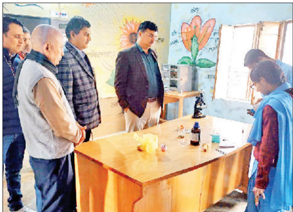
सोनीपत। स्कूलों में छात्रों की ज्ञान की परीक्षा लेते टीम के सदस्य।