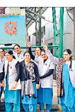
किया तो आंदोलन किया जाएगा। नर्सिंग स्टाफ एसोसिएशन की पूर्व